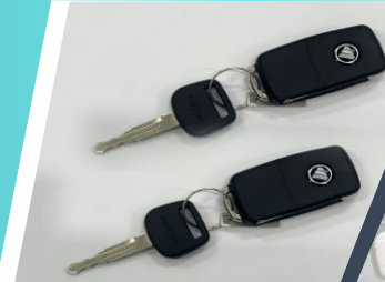
CHÌA KHÓA điện điều khiển từ xa

→ Hệ thống đèn trang bị tính năng hiện đại DUY NHẤT trong phân khúc tải nhỏ máy xăng.