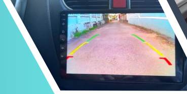
Camera GÓC LUI RỘNG