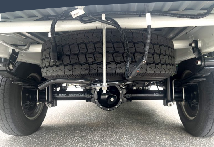
Cấu ĐÚC NGUYÊN KHỐI chịu TẢI CAO