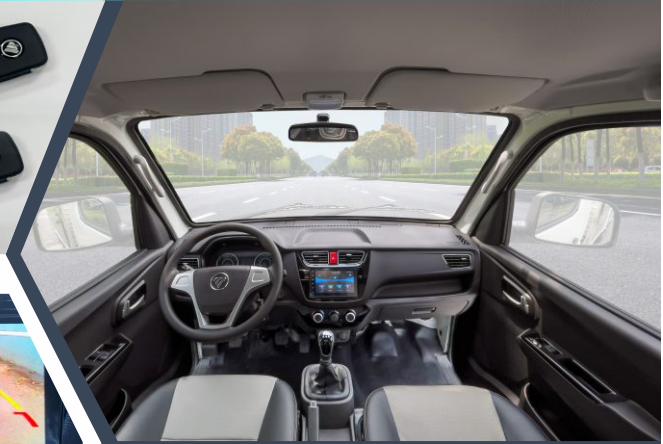
KHOANG NỘI THẤT thiết kế tinh tế, rộng rãi, trang bị tiện nghi SANG TRỌNG - HIỆN ĐẠI